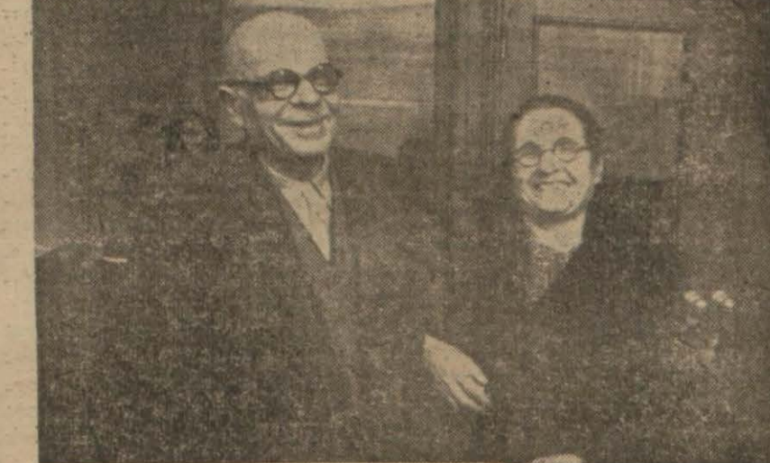
Talihli kadın dün Piyango müdürlüğünde kocasıyla beraber neşeli günde gülerken (Yazısı 6 inci sayfa)

Dün paralarını alan ihtiyar talihli: “Bunu biliyordum, rüyasını görmüştüm,” diyor