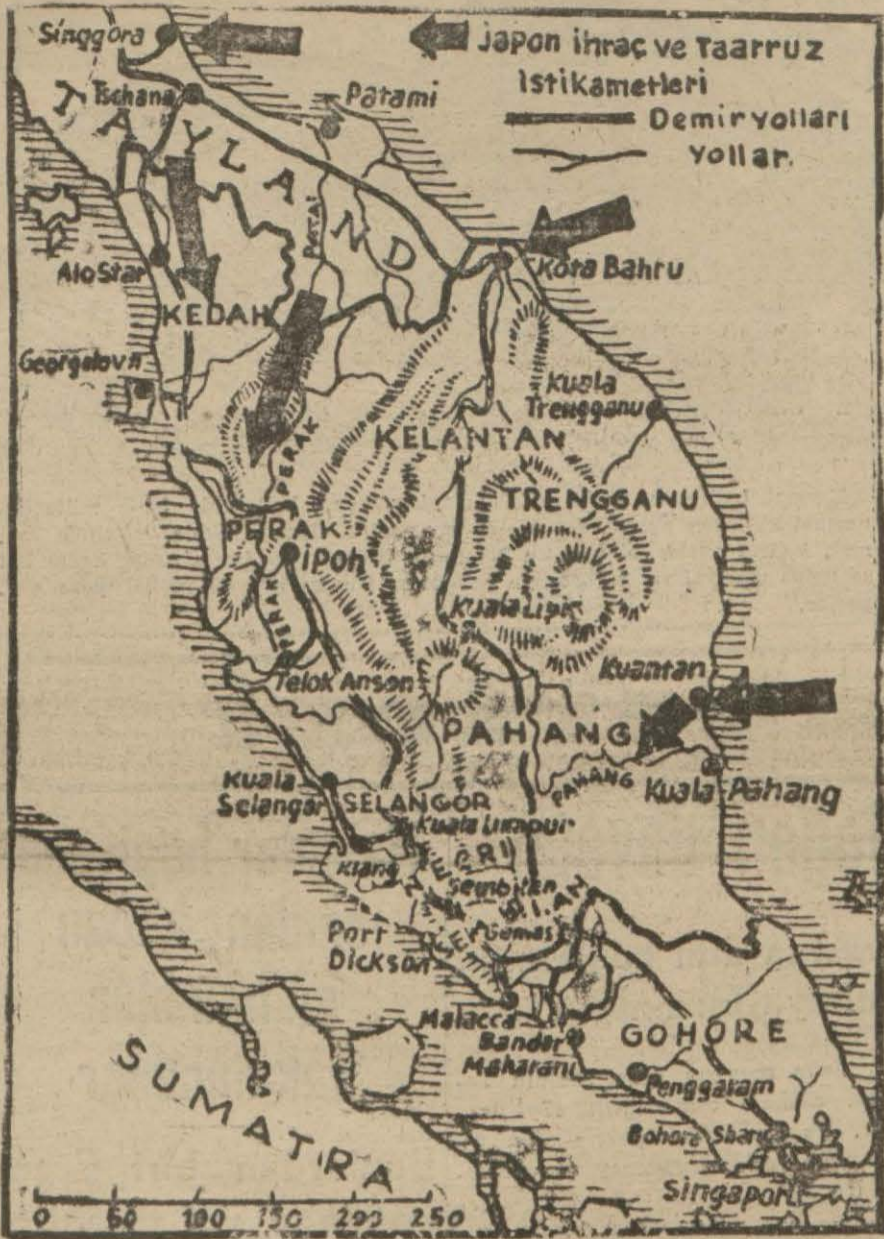
Singapur'u gösteren harita

BUGÜN Bir medeniyetin sonu Avrupa ilmi kendinden utansın! Yazan: Ahmed Hamdi Başar (Bu sayıyı dikkatle yazın bugün 3 üncü sayfamızda bulacaksınız)