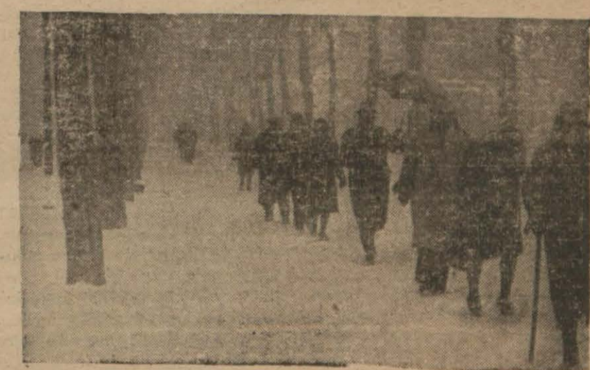
İstanbul caddelerinin dünkü manzarası Birkaç gündüberi, fasıllı surette etmiştir. Gece rüzgâr saniyede 22 metreye hızla esmiştir. Dün sabah, sokaklardaki karın irtifakı, tipik dün ögleye kadar devam etmiştir. (Devamı 6 inci sayfa)

Şehirde kar bazı yerlerde yarım metreyi buldu, tramvay, vapur, tren seferleri intizamını kaybetti